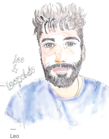
Leo ↳ Leopoldo